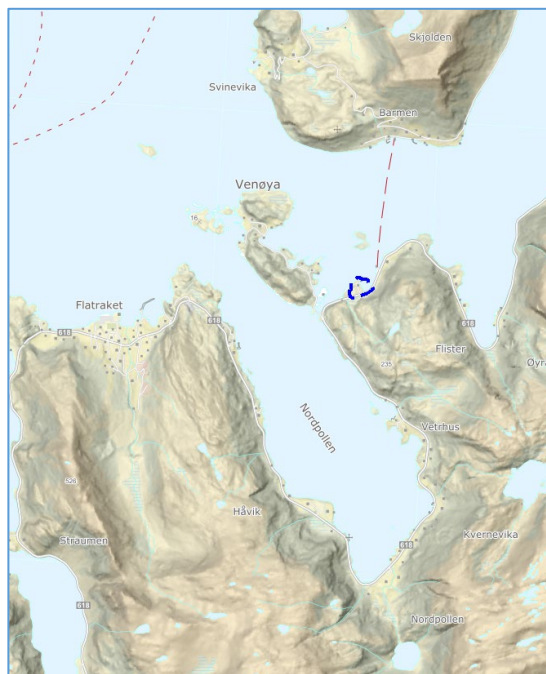
Figur 2 Lokalisering av planområdet, markert med blå avgrensing